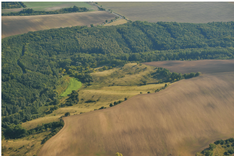
Obr. 1. – Letecký snímek údolí Podbradeckého potoka v úseku, kde byl odebrán pyloanalytický profil (na dně údolí zhruba uprostřed snímku). Foto: P. Pokorný.

Fig. 1. – Aerial view of the Podbradecký Brook valley with the site sampled for pollen analyses (in the middle of the photograph, situated on the valley bottom). Photo: P. Pokorný.