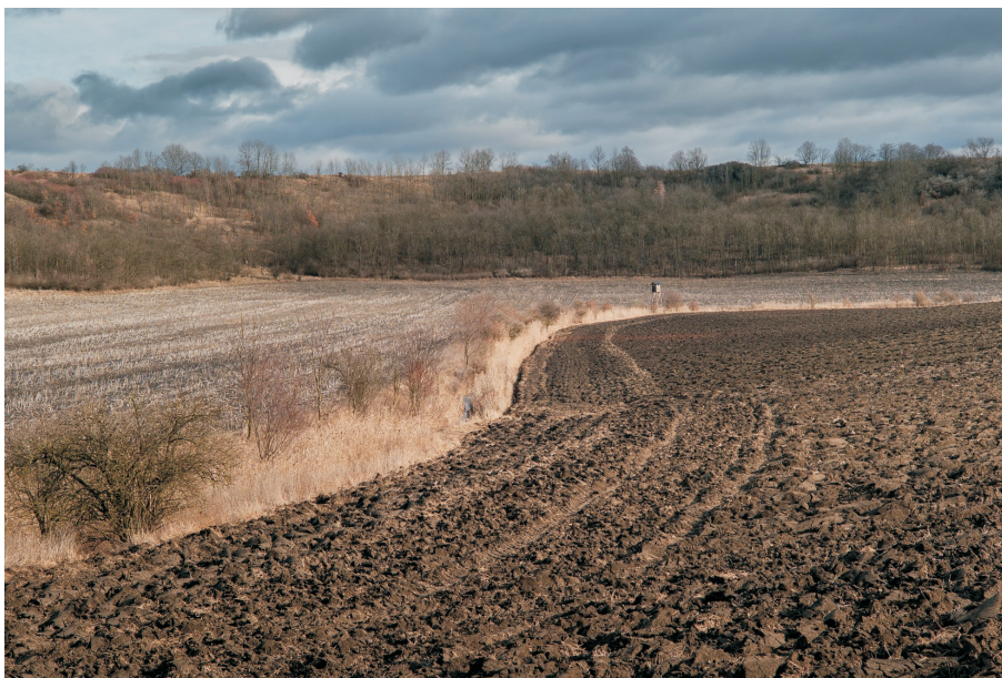
Obr. 2. – Lokalita Suchý potok v místě odběru paleomalakologického profilu. Fig. 2. – Suchý potok, location of a sediment sample taken for mollusc analyses.

Procentuální hodnoty pylového diagramu byly počítány na základě celkového počtu pylových zrn ( AP+NAP=100\% ), byly však vyloučeny taxony vodních a bahenních rostlin kvůli jejich lokální indikační hodnotě a nebezpečí lokální nadprodukce. Pylový diagram (obr. 3) byl sestaven pomocí programu TILIA (E. C. Grimm, Springfield, IL, USA). Lokální pyloanalytické zóny (LPAZ = Local Pollen-Analytical Zones) byly rozlišeny expertním odhadem na základě prevalence a abundance jednotlivých taxonů.