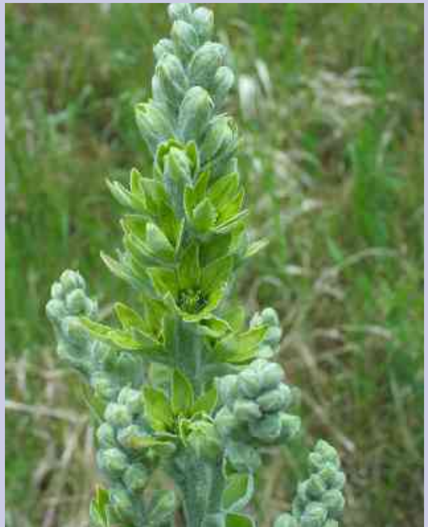
Veratrum album subsp. lobelianum