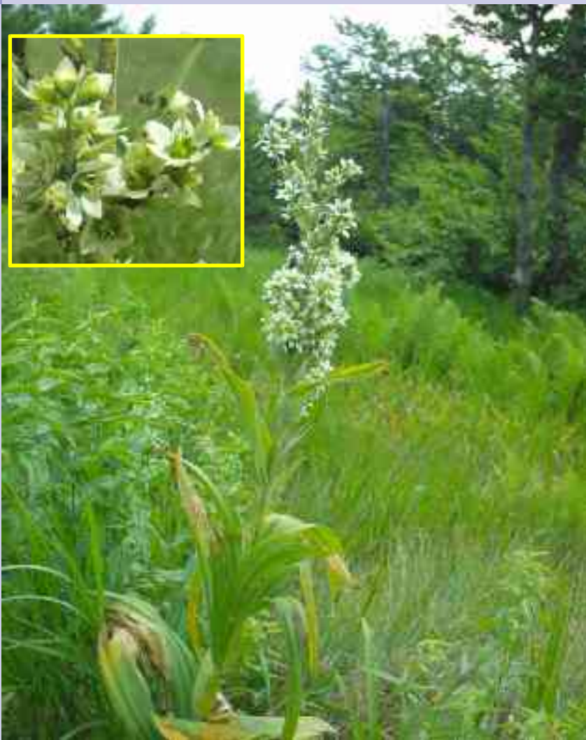
Veratrum album subsp. album