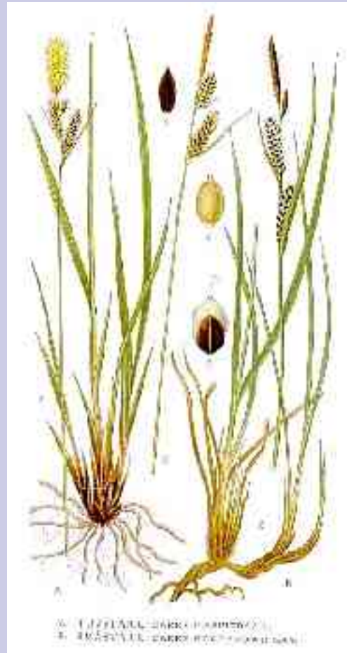
Carex subg. Carex