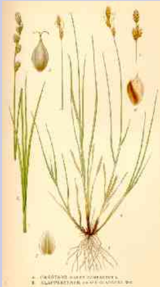
Carex subg. Vignea