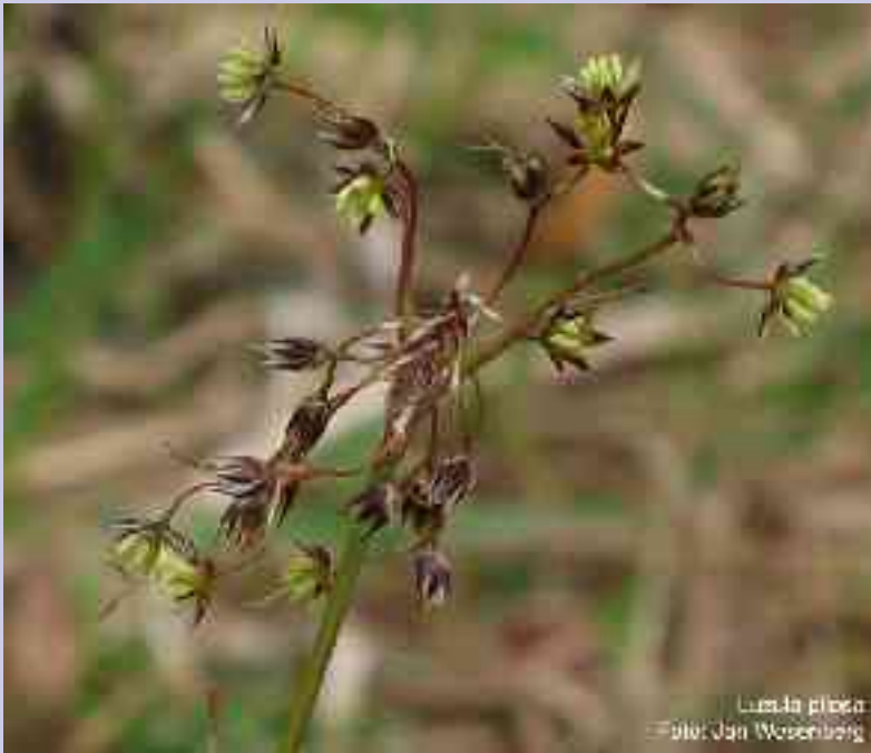
Luzula pilosa