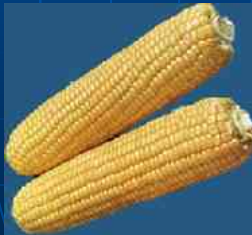
Z. mays subsp. saccharata