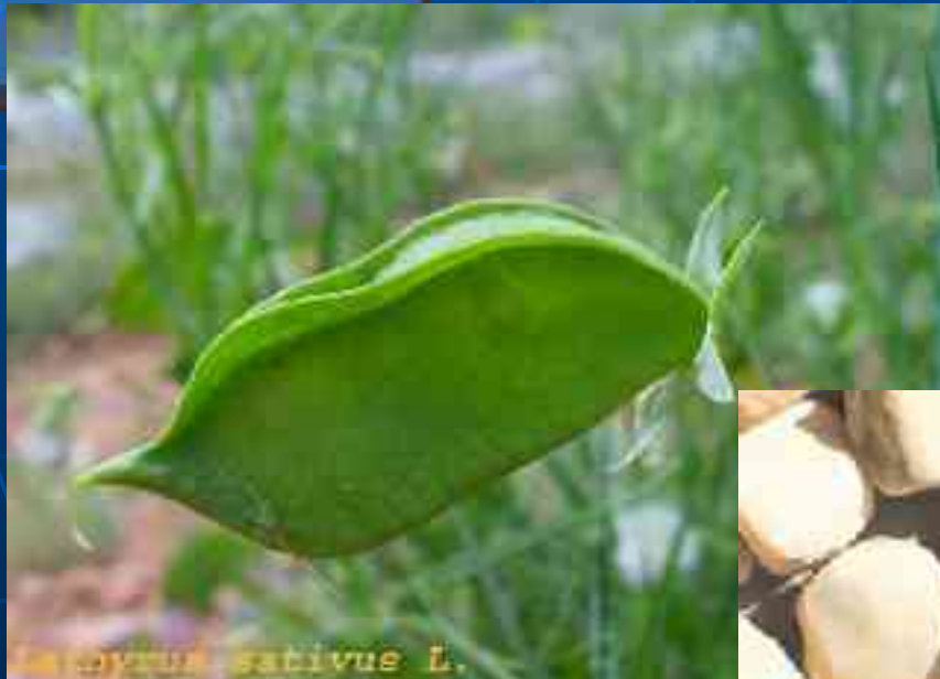
Lathyrus sativus L.