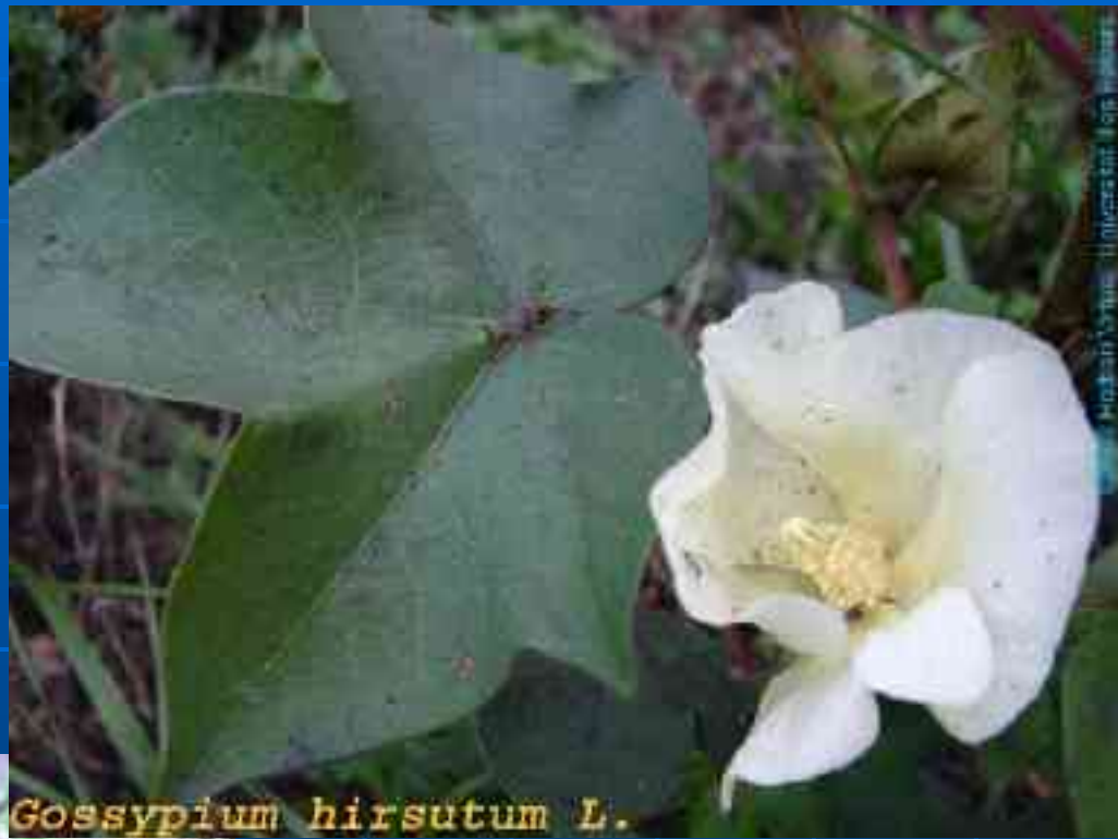
Gossypium hirsutum L.