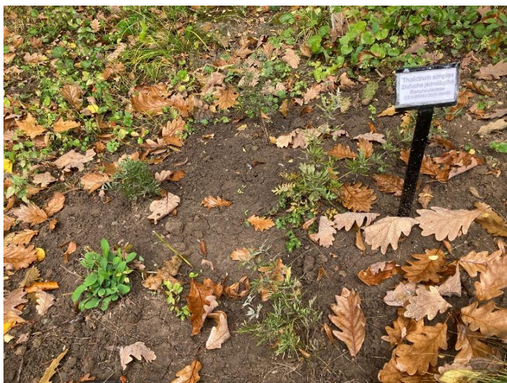
Žlutucha jednoduchá v botanické zahradě