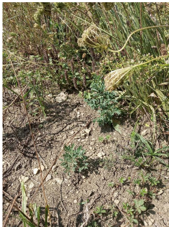
Lokalita žluťuchy jednoduché u Velké nad Veličkou (okres Hodonín), foto Karel Fajmon